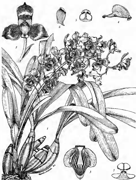
Pl. 1. — Grammangis Ellisii (Lindl.) Rehb. f.; 1, port de la plante; 2, fleur vue de face; 3, labelle étalé; 4, labelle profil; 5, anthère vue de face; 6, pétale; 7, pollinaire.